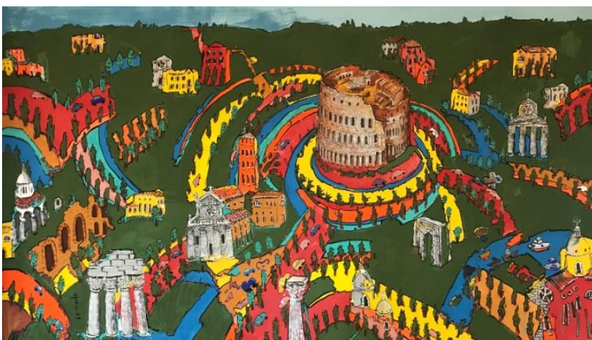
アフレスコ「緑色大地」制作記録映像 2020年