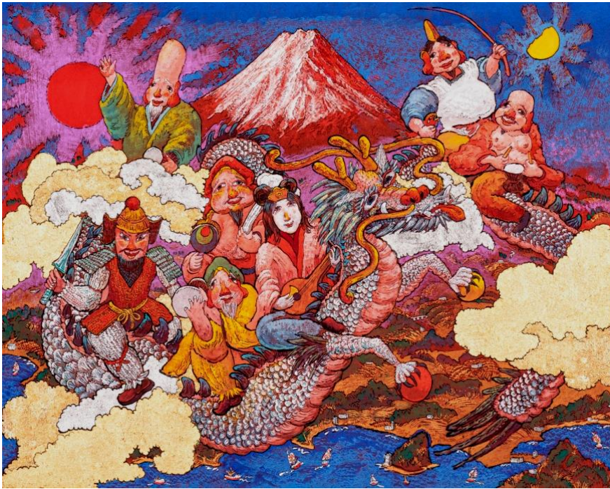
「天空富嶽飛龍七福神」 2015年 100号 (1303×1621)

「不二」の壮麗な姿は悠久の時を語り、燦々と輝く朝陽は生命へのオマージュそのものである。森羅万象に包まれながら、美神のごとく神々しく浮かび上がる龍神と童子たちは「復活」の時を告げるもので、そこには新たに生まれ出る生命への歓喜、慈愛、そして煌々たる旅立ちへの祈りが込められている。