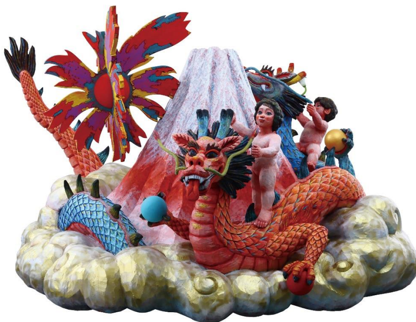
「朝陽富嶽玉取り龍 不二法門」2019年 H2100×W3000×D3200

積水ハウス株式会社が設立・運営する「絹谷幸二 天空美術館」(梅田スカイビル タワーウエスト 27階)で、 特別展示「美神降臨 ~ 《復活》の時」を8月1日(土)~12月14日(月)に開催いたします。