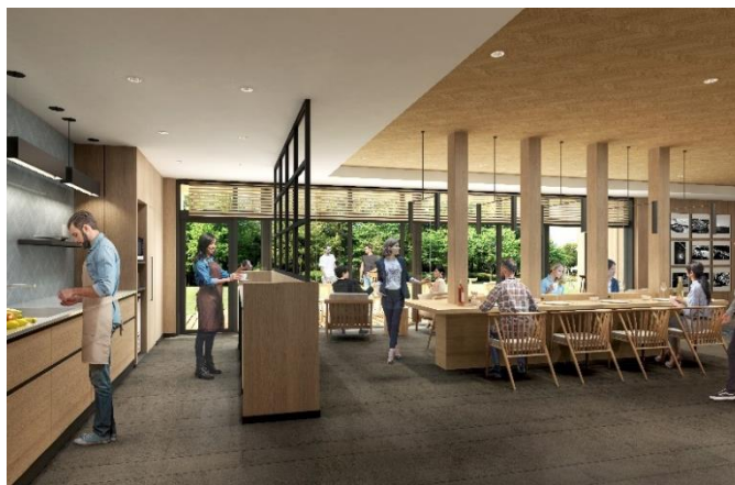
大型の共有コミュニティーカウンター

詳しい情報は、 fairfield.marriott.com をご覧ください。また、Facebook や Twitter (@FairfieldHotels) にて最新情報もご確認いただけます。世界各国に 1000 軒以上のホテルを展開するフェアフィールドは、数多くの受賞歴を誇る旅行プログラム、Marriott Bonvoy (マリオット ボンヴォイ) に参加しています。本プログラムは、会員の皆様に類を見ないグローバルブランドの数々や Marriott Bonvoy Moments での会員限定の体験、そして無料ホテル宿泊に向けたポイントやエリートステータス昇格に向けた泊数獲得を含む、比類なき特典をお届けします。無料会員登録やプログラム詳細については、 MarriottBonvoy.marriott.com をご覧ください。