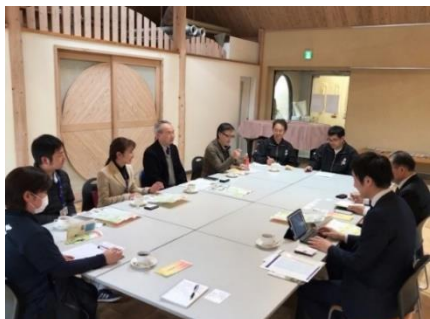
岐阜県郡上市にて地域の課題を議題にワークショップを実施（2020 年 2 月実施）

2018 年に事業発表して以来、地域経済の活性化を目指し、全国各地の地域や自治体と事業検討を進めてきました。2020 年 7 月現在、賛同いただいた 25 道府県とともに、拠点となる道の駅の選定およびホテル開発の計画を進めております。本プロジェクトを機に、岐阜県郡上市では地域の課題解決のため地域の方々とのワークショップの実施や、三重県御浜町では初の観光案内所となる七里御浜ツーリストインフォメーションセンターを開設するなど、実際に地域に変化が起こっている事例も出ています。