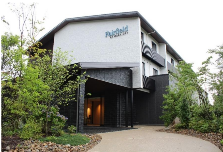
地域の知られざる魅力を渡り歩く新たな旅の拠点となるホテル「フェアフィールド・バイ・マリオット」

今後、全国各地の地方創生の一助となることを目指し、さらに地域や自治体、パートナー企業との連携を進め、2025年には25道府県にて約3,000室規模への拡大を目指してまいります。