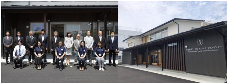
三重県御浜町に新設された「七里御浜ツーリストインフォメーションセンター」 英語対応可能な職員も常駐。観光客の受け入れ態勢を強化し、地域経済の活性化を目指す