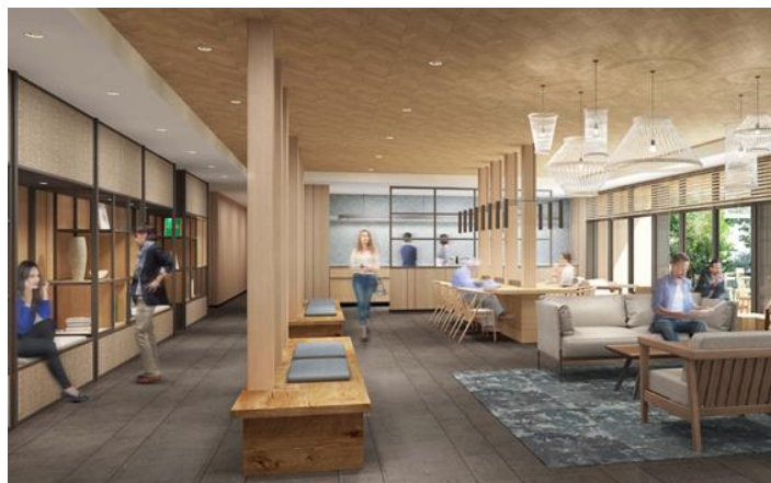
共有スペースは、飲食スペースやコワーキングスペースとして利用可能