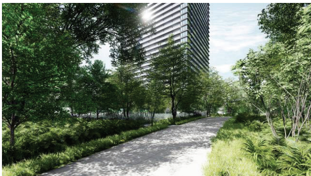
「緑地広場 (多目的広場)」パス

さらに 871 戸全戸に家庭用燃料電池「エネファーム type S」を設置し、省エネと省 CO 2 による環境配慮を実現します。