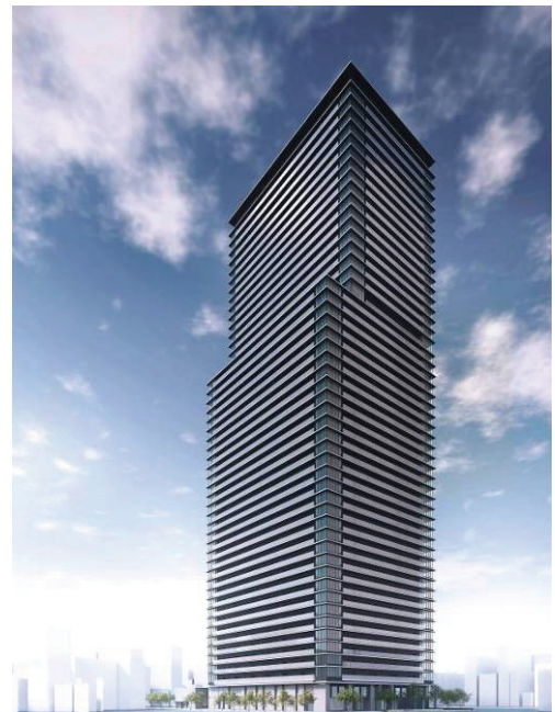
南西側外観パース

871戸全戸に家庭用燃料電池「エネファーム type S」を設置し、省エネと省CO 2 による環境配慮を実現します。さらに敷地内に「防災備蓄倉庫」を設置して地域の防災力向上にも寄与。また、商業施設、保育施設の誘致や「ザ・シンフォニーホール」と連携した「にぎわい・文化施設」（貸音楽室）の設置で地域のにぎわいも創出します。