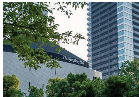
ザ・シンフォニーホール

商業施設と保育施設を誘致するとともに、「ザ・シンフォニーホール」と連携した「にぎわい・文化施設」（貸音楽室）の導入も予定しており、人口が増加する地域のにぎわいと利便性の向上を図ります。また、本計画地北側に「施設棟」を設置し、災害時に地域住民の防災・救助活動に役立つ備品を収めた「防災備蓄倉庫」を設置します。