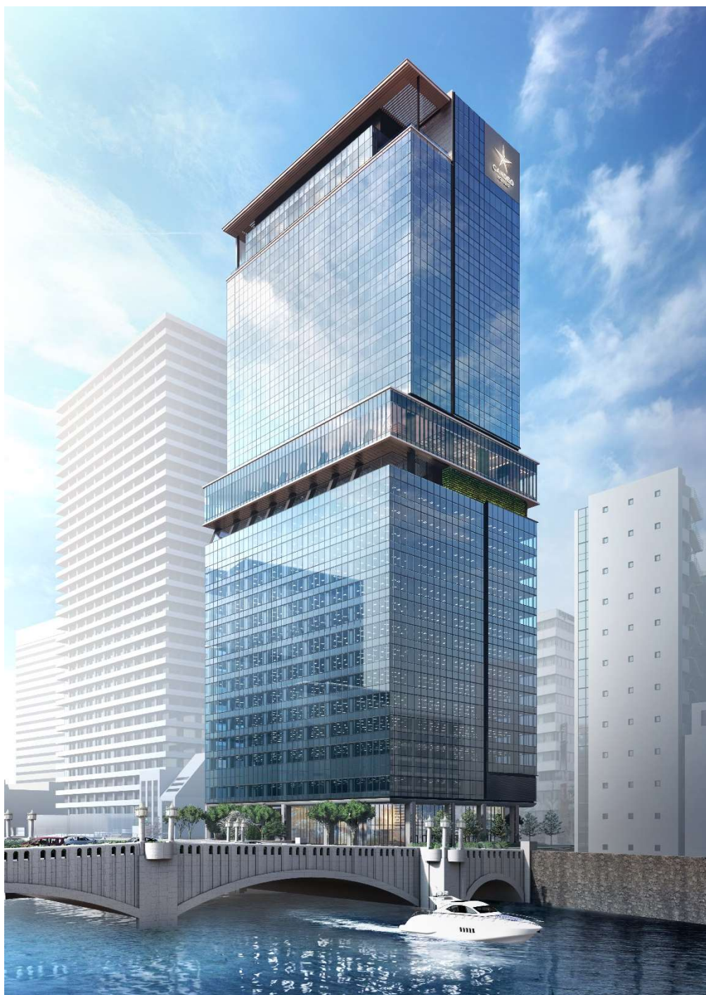
建物イメージ（南東から）