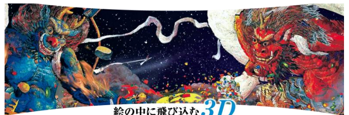
絵の中に飛び込む 3D