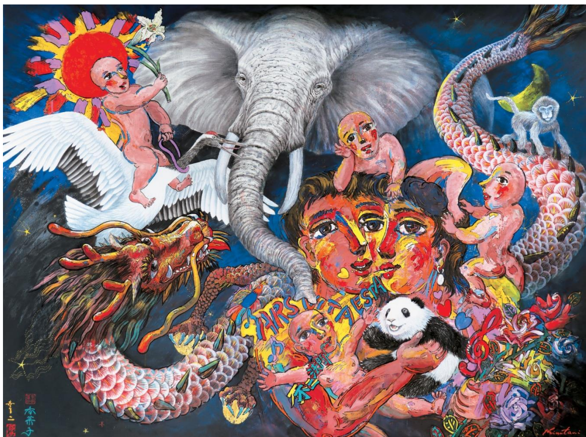
絹谷幸二・絹谷香菜子『 いのち 生命輝く』 2017年 200号 (1940×2590)

新登場の、画家とつながるVR(バーチャルリアリティ)体験も、併せてお楽しみください。