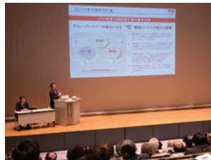
会社説明会・セミナーの様子