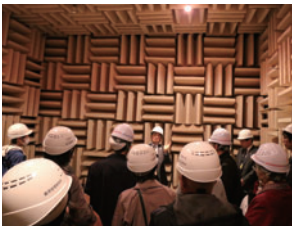
「総合住宅研究所」見学会の様子

投資家様に対しては、各地で開催している会社説明会・セミナーなど、事業内容への理解を深めていただく機会を設けています。さらに企業・IR情報を掲載したホームページや株主様向けの事業報告書「ビジネスレポート」においても、経営戦略や経営計画について分かりやすく説明しています。