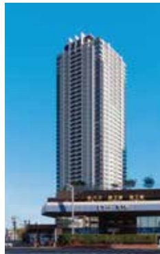
分譲マンション「グランドメゾン池下ザ・タワー」