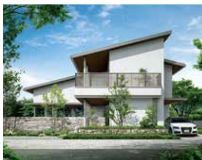
鉄骨2階建て住宅「ビー・モード ジェント」