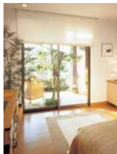
開口部のリフォームで断熱性・防犯性を向上