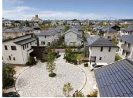
スマートタウン 「スマートコミュニティ 明石台」

■主な関係会社 ◎積和不動産7社(不動産売買等) ◎積和建設20社(住宅の施工等) ほか