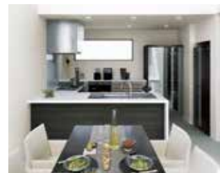
間取り変更と最新設備導入で より快適な暮らしを実現

■主な関係会社 | ©積水ハウスリフォーム株式会社(住宅の増改築等) ©積和建設20社(住宅の増改築等) ©積和不動産7社(賃貸住宅の増改築等) ほか