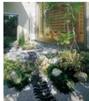
外構・造園施工例