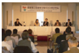
シンポジウムには多様なセクターから多くの方々が参加しました

「障害者と社会をつなぐシンポジウム」では、「被災地から、そして関西から。地域、施設、企業の取り組み～私たちにできること～」と題したパネルディスカッションを実施。行政・企業・NPO・市民がともに考え、話し合う有意義な場となりました。