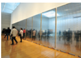
撮影:高橋 章氏 壁画《都市流動》1969年 丸亀市猪熊弦一郎現代美術館「祝20祭」での展示風景

2011年9月、旧ホテルフジタ京都(京都市)の建て替え工事に伴い、壁画「都市流動」を猪熊弦一郎現代美術館(香川県丸亀市)に寄贈しました。壁画「都市流動」は、同ホテル開業以来1階ロビーを飾っていましたが、1982年実施の改修工事で壁画の前に壁が作られて以降、行方がわからなくなっていた作品です。解体工事前にその存在が判明したため、工事実施時に取り外し、同美術館に寄贈しました。