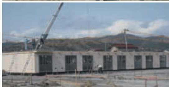
急ピッチで進む仮設住宅の建設

政府・自治体の協力要請に応え、仮設住宅の建設にも協力しています。当社は宮城県、岩手県、福島県で着工。断熱性に優れ、バス・トイレを完備した仮設住宅（約4000戸を予定）が、全国から応援に駆け付けた施工担当者により急ピッチで建設されています。