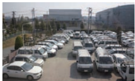
支援チームの車両で駐車場は満杯