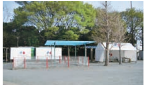
仮設トイレを分譲地内の公園に設置