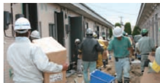
全国から駆け付けた多くの施工担当者が建設に従事