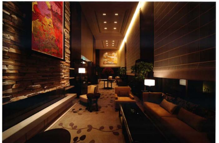
レセプションハウスでも体感できる「ザ・レセプション」(左)と「ザ・リビング」(右)