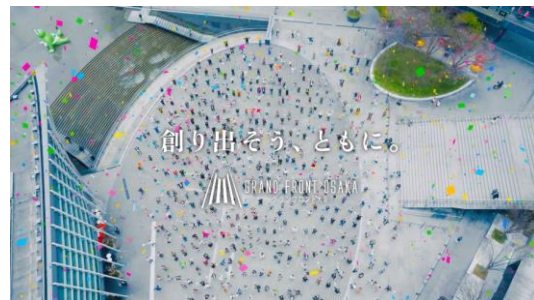
▲新ビジョンを表現した「GRAND VISION MOVIE」