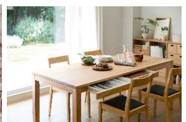
【関西最大店舗】 無印良品/Café & Meal MUJI 秋に店舗拡大オープン予定