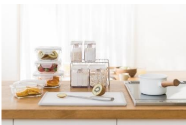
【関西最大店舗】 KEYUCA 4月28日移転オープン予定

URLはこちら: https://www.grandfront-osaka.jp/files/20230221/b3f339d8b53cf4a87148c90244cb85110776457b.pdf