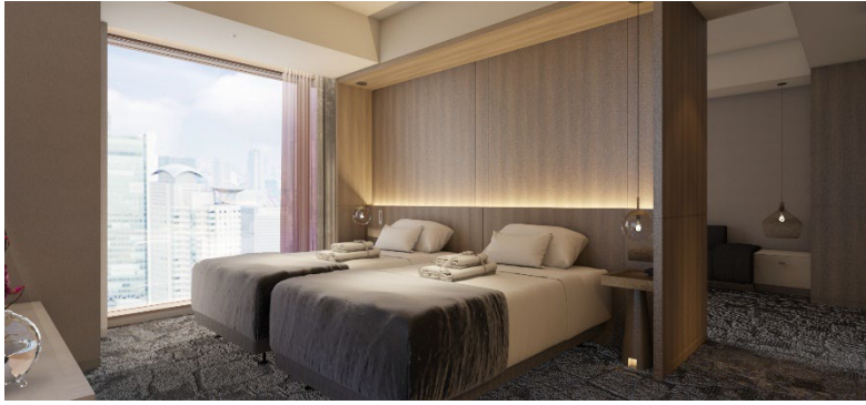
客室（完成予想イメージ）

全 482 室の客室は、2 名までのお客さまをおもてなしする構成になっており、自然体でゆったりとした時間を過ごせる“大人が楽しめる空間”を創出しています。