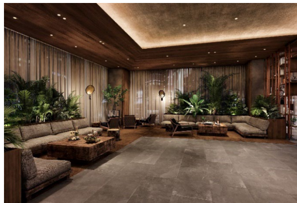
▲ホテルロビー（完成予想イメージ）