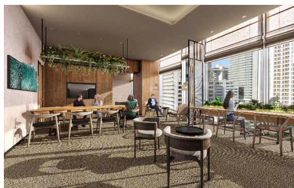
▲宿泊者専用ラウンジ（完成予想イメージ）