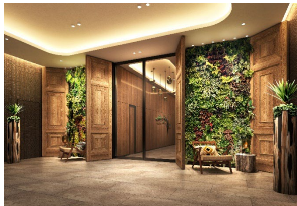
▲エントランス（完成予想イメージ）

大阪（梅田）を拠点にした、観光・レジャー目的の旅慣れた大人のインバウンドツーリストをメインターゲットにしており、ここにしかない新たな価値を創出することで、お客さまを、都会の喧騒を忘れることができる別世界へと誘います。