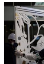
▲「防災白パネル」イメージ