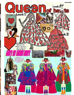
GRAND WISH STUDENT COLLECTION 展示衣装イメージ

※新型コロナウイルス感染拡大の状況等により、本イベント内容は一部変更、または中止となる可能性がございます