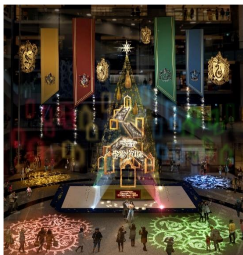
▲演出時のイメージ

「ハリー・ポッター」魔法ワールドの物語に登場するモチーフが各所に散りばめられた約 13m のメインクリスマスツリー『Floating Magic Tree 浮遊する魔法の樹』がナレッジプラザに登場。