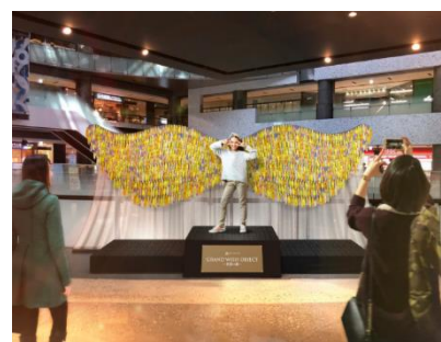
GRAND WISH OBJECT～希望の翼～ オブジェ完成イメージ