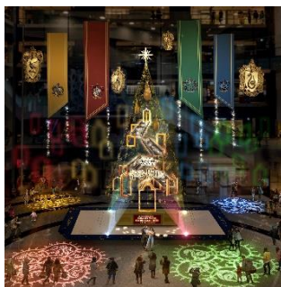
メインクリスマスツリー 『Floating Magic Tree 浮遊する魔法の樹』