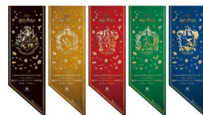
各所に「ハリー・ポッター」魔法ワールドモチーフの装飾が登場！

※新型コロナウイルス感染拡大の状況等により、本イベント内容は一部変更、または中止となる可能性がございます。