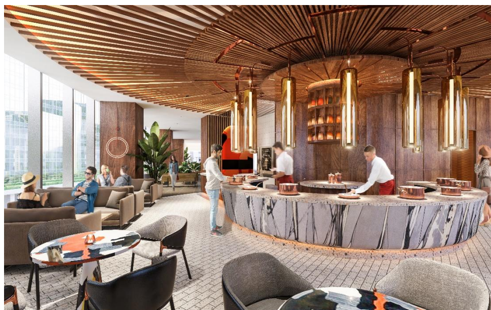
キャンオピーby ヒルトン大阪梅田「キャンオピー・セントラル」(完成予想イメージ) ※今後変更となる可能性があります

ヒルトンのライフスタイルブランド「キャンオピーby ヒルトン」は、リラックスして充電できるネイバーフッドのような場所であり、お客さま志向のシンプルなサービス、快適な空間とその土地ならではのこだわりのものを提供します。ホテルはそのエリアからインスピレーションを受けたデザインや、新しいアプローチでおもてなしとご滞在をお客さまにお届けします。現在、キャンオピーby ヒルトンは世界で32軒展開し、15の国・地域で29軒が開業予定です。