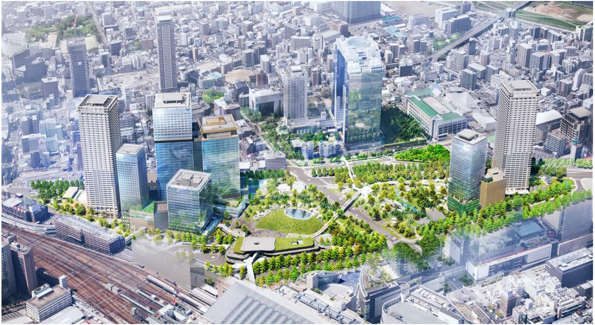
うめきた 2 期地区全景（完成予想イメージ）※今後変更となる可能性があります