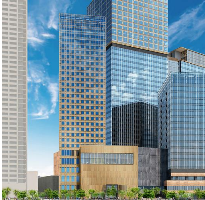
US ホテル「外観」(完成予想イメージ) ※今後変更となる可能性があります

US ホテルは、南街区賃貸棟・東棟の5階～28階に位置します。客室は23平米を中心とする482室で、レストラン、バー、フィットネスを設置予定です。