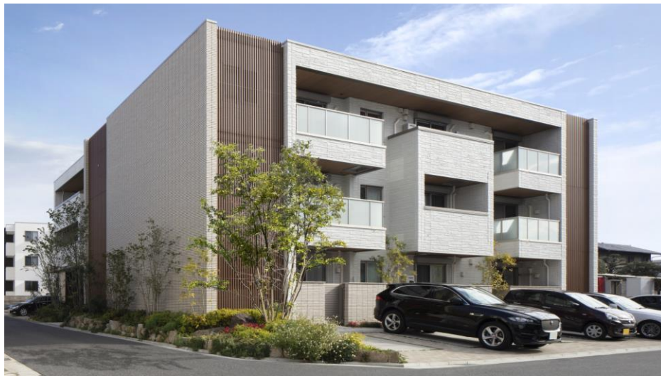
賃貸住宅「シャームゾン」に併設する駐車場を有効活用

積水ハウス株式会社とタイムズ24株式会社、タイムズモビリティ株式会社は、積水ハウスの賃貸住宅「シャームゾン」に併設する駐車場に、タイムズの駐車場シェアリングサービスおよびカーシェアリングサービスを全国規模で展開する業務提携契約を締結いたしました。3社の連携により、ライフスタイルの変化に合わせた駐車場の新たな価値提案と、サービスの拡大による利用者の利便性向上を目指します。サービス導入は、2021年6月より順次開始してまいります。